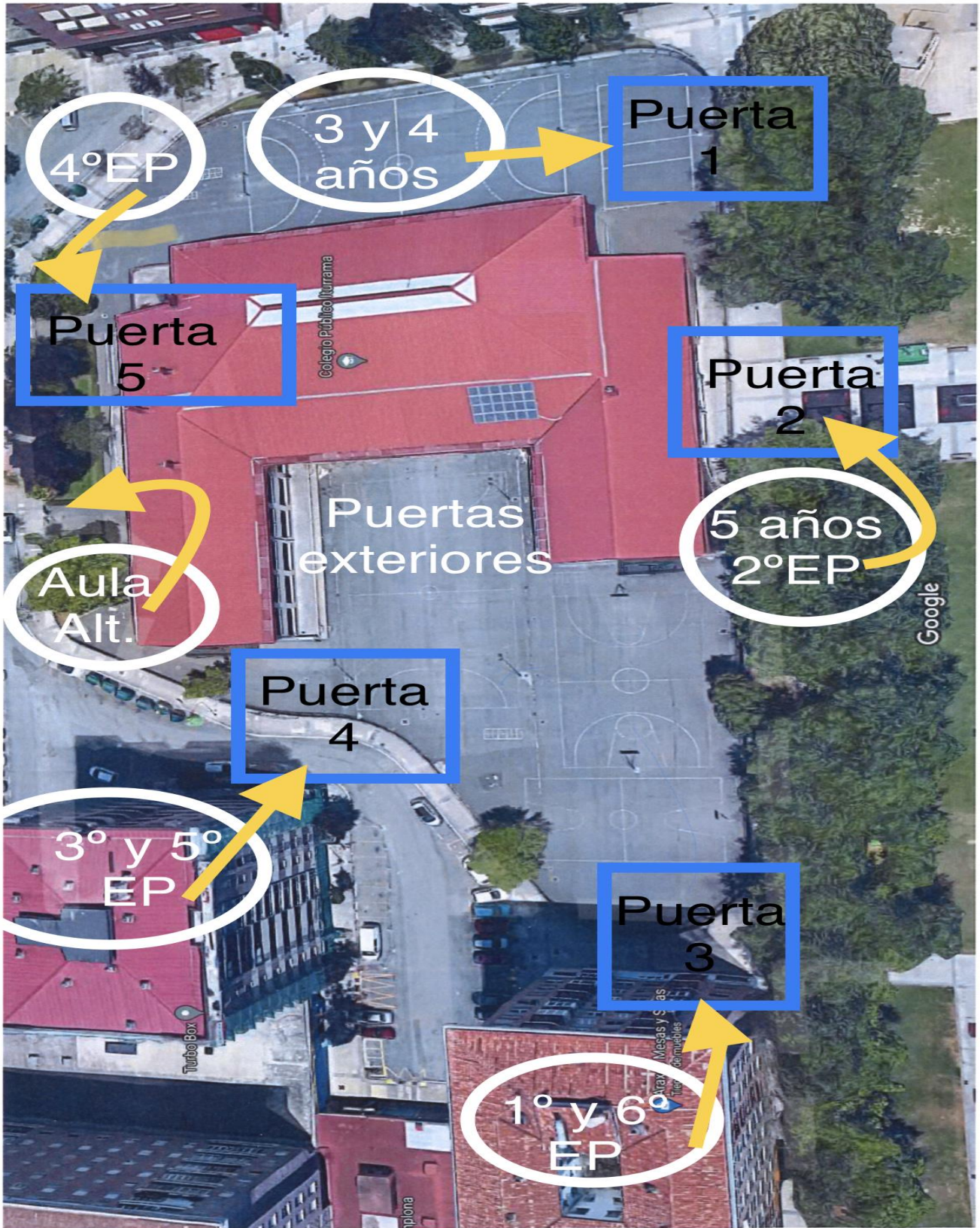
PUERTAS EXTERIORES (VERJA)